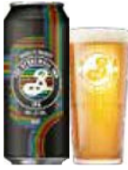
BROOKLYN STONEWALL INN IPA

En lys, gyldengul session IPA. Humleduften byder på referencer til citrus, ananas & mango, og mundførmelsen er blød mens smagen domineres af en afstemt frisk, mild og humlet bitterhed.