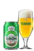
GRØN TUBORG ØKOLOGISK

Alkoholprocent: 4,6 33 cl fl, 33/50 cl ds, 20 l flex / 20 l MD / 25 l Stål