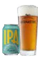
BREWMASTERS INDIA PALE ALE

Brewmasters Collection India Pale Ale er en ravgylde ale med en frisk humleduft, en velbalanceret smag og en god efterbitterhed.