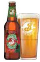
BROOKLYN EAST IPA

Er velhumlet med rige noter af hylde og citrus.