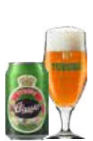
TUBORG CLASSIC ØKOLOGISK

Alkoholprocent: 4,6 33 cl fl, 33/50 cl ds, 20 l flex / 20 l MD / 25 l Stål