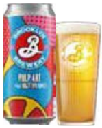
BROOKLYN PULP ART

Brooklyn Pulp Art IPA, er en hazy IPA. Duften er præget af tropiske citrusfrugter, og smagen er frisk, med noter af citrus og mango.