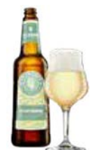
JACOBSEN VELVET GALAXY

Alkoholprocent: 6,5 33/50 cl ds, 33/75 cl fl, 20 l MD