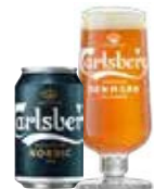
CARLSBERG NORDIC ALE

Alkoholprocent: 0,5 33 cl fl, 33 cl ds, 20 l MD