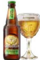
GRIMBERGEN BELGIAN PALE ALE

Grimbergen Belgian Pale Ale dufter af tropisk frugt og citrus. Smagen er velbalanceret med mindre sødme end kendes fra andre Grimbergen varianter.